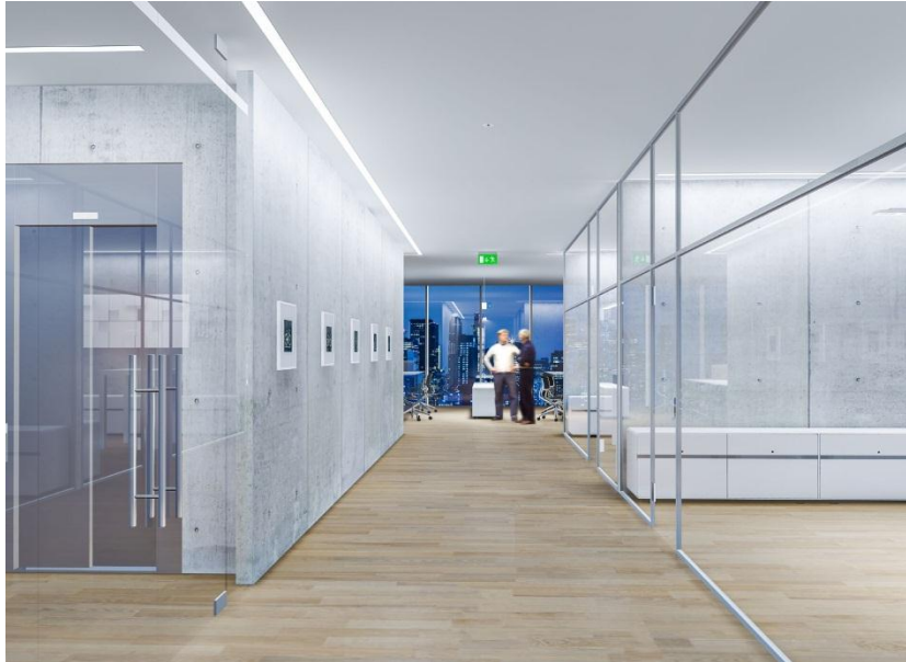
Image 2: La version d'extension de SLOTLIGHT offre une optique opale, fournie avec une vasque continue d'une seule pièce de jusqu'à 20 mètres.